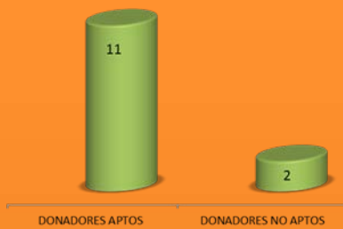
HOSPITAL JUÁREZ CENTRO 2014

Total de donadores registrados: 13 donadores.